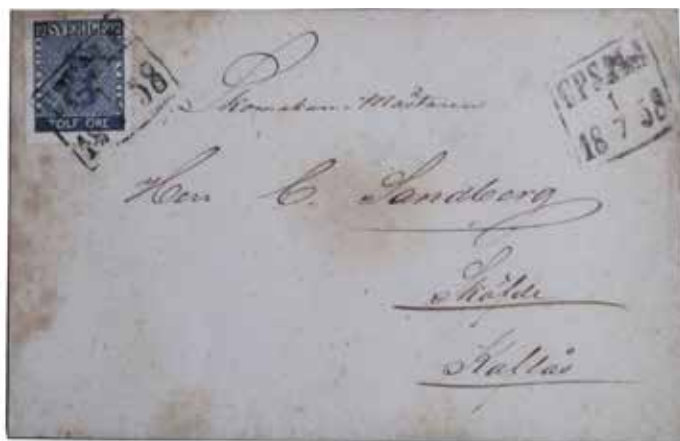
F9a 12 öre Vapen stämplat UPSALA 1/7 1858 såld på Swestamps auktion för 57 000 kr (47 500 kr + provision)