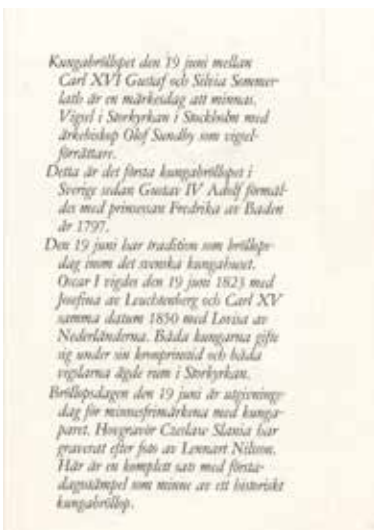
Minneshäfte (MH10) den 19/6 1976