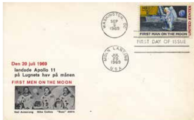
FDC 9/9 1969 "First man on the moon" med svenskspråkig vinjett

dessutom på olika språk. Amerikanska FDC kan vara ett intressant samlarområde och kan läsas om på www.afdc.org (American FDC Society).