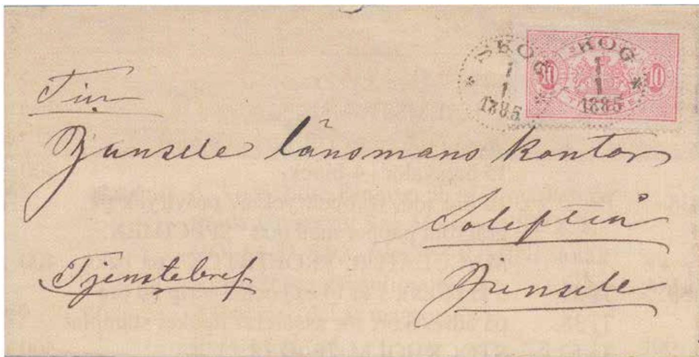
Höstens dyraste FDC, 10 öre röd tjänstefrimärke Tj 16Aa SKOG 1/1 1885. Sål för 26 840 kronor inklusive provision.