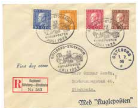
FDC 15,20,25,30 öre GÖTEBORG 1 1/7 1936 (den vanligast förekommande FDC-stämpeln)