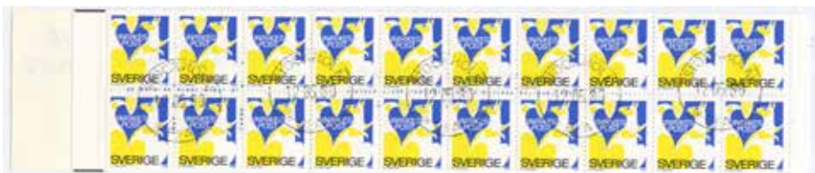
H321 Rabattmärke II 12/5 1980