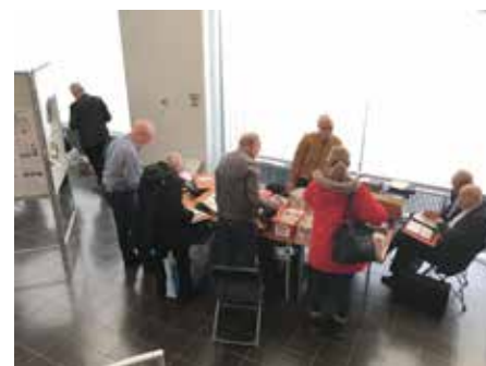
Vinjetter och bruksstämplade FDC visade sig vara riktigt populära.