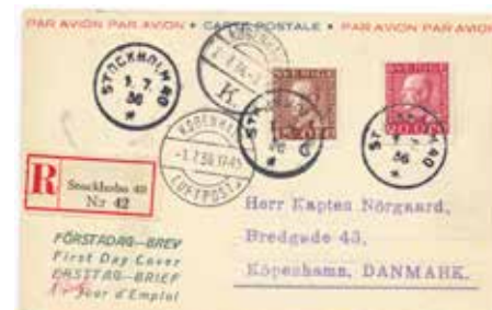
FDC 15, 20 öre bruksstämplat STOCKHOLM 40 1/7 1936