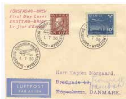
FDC 15 öre (+ flygpostmärke) med stämpeln STOCKHOLM-MALMÖ-AMSTERDAM 1/7 1936