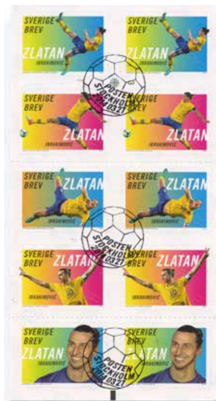
Zlatan var motivet på ett populärt häfte som gavs ut 27/3 2014.

Kanske något att passa på att börja samla?