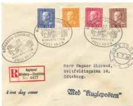
FDC 15,20,25,30 öre GÖTEBORG 1 1/7 1936 (den något ovanligare Göteborgsstämpeln och sällsynta 15 öre 4-sidig tandning)