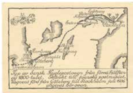
Minneskort med färdvägen

Samma dag, den 1 juli 1936, kom det nya frimärken. Gustaf V profil vänster: 15 öre brun (2- och 4-sidig) och 25 öre orange. Dessutom 20 öre röd och 30 öre blå, båda på vitt papper.