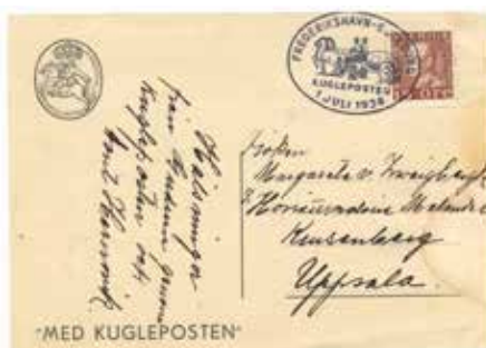
FDC 15 öre (F178 A) med stämpeln FREDERIKSHAVN-GÖTEBORG 1 JULI 1936